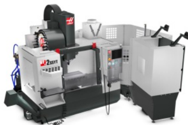
Haas VF-2SSYT + Pallet Pool 3+1