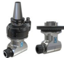
Główce kątowe i oprawki napędzane Gerardi