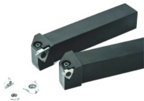
Narzędzia tokarskie Kyocera