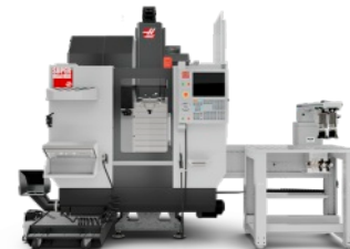
Haas Super MiniMill + Compact APL + imadło pneumatyczne