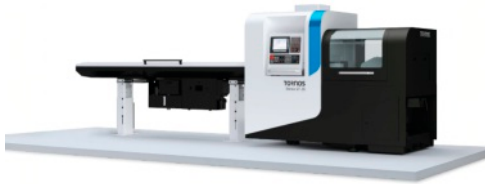
Tornos GT26 z podajnikiem prętów