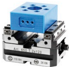
Imadła pięciosiowe Gerardi