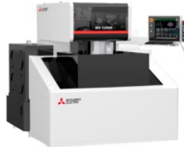
Mitsubishi MV 1200R