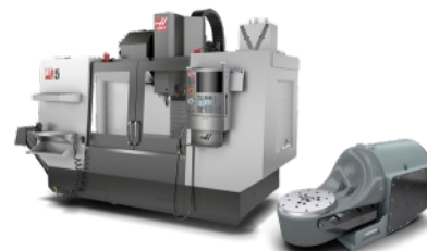
Haas VF-5 + Haas TRT-210