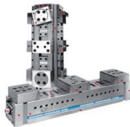
Imadła oraz kolumny Gerardi