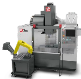
Haas VF-2SS + Haas Robot Package 1 + imadło pneumatyczne