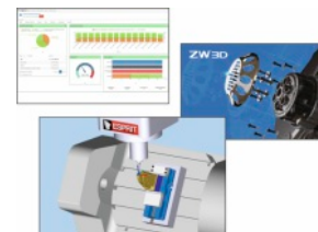
Oprogramowanie Esprit / ZW3D / Groth