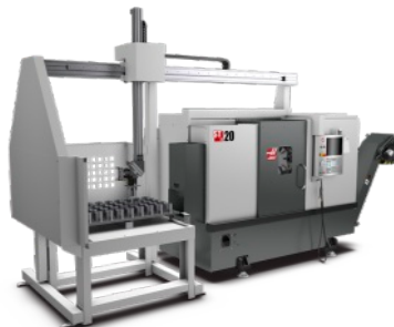
Haas ST-20Y + APL