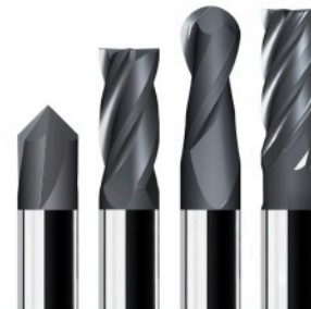
Frezy monolityczne Van Hoorn