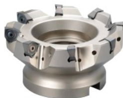
Narzędzia frezarskie Kyocera