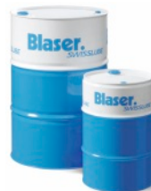
Chłodziwa i systemy Blaser