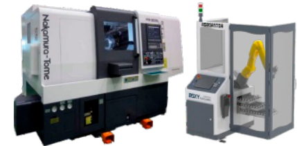
Nakamura-Tome AS-200L + ROBORATOR VI